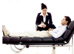
Anoressia, ansia, panico, gastriti, sesso. »