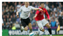
Calcio e attività sportive»

Il Segretario di Stato dell'Oman ha così dichiarato il premio: "Sono molto onorato di aver ricevuto questo premio. Il mio compito è portare lavoro, portare umanità, difendere i più deboli. Questo premio darà un grande contributo al legame tra i due Paesi" .