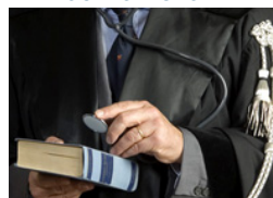
Poni gratuitamente le tue domande ad un avvocato. »